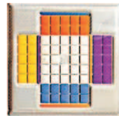
Le joueur A prend les pions oranges et le joueur B les pions bleus.