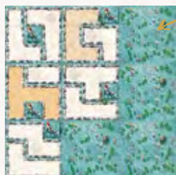
Exemple de mise en place pour 2 joueurs

Attention ! La tuile centrale ne doit jamais être retournée. Les tuiles côté eau ne serviront pas pendant la partie.