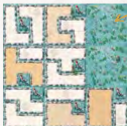
Exemple de mise en place pour 3 joueurs